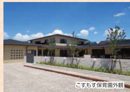
こすもす保育園外観