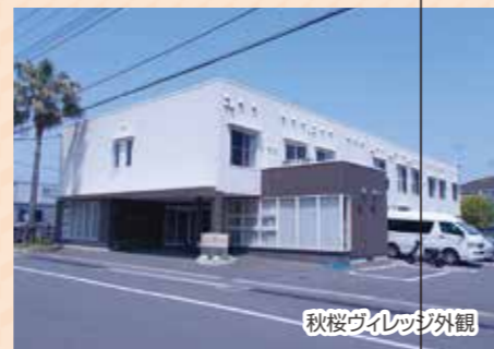
秋桜ヴィレッジ外観