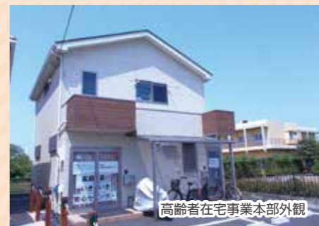
高齢者在宅事業本部外観