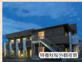
特養秋桜外観夜景