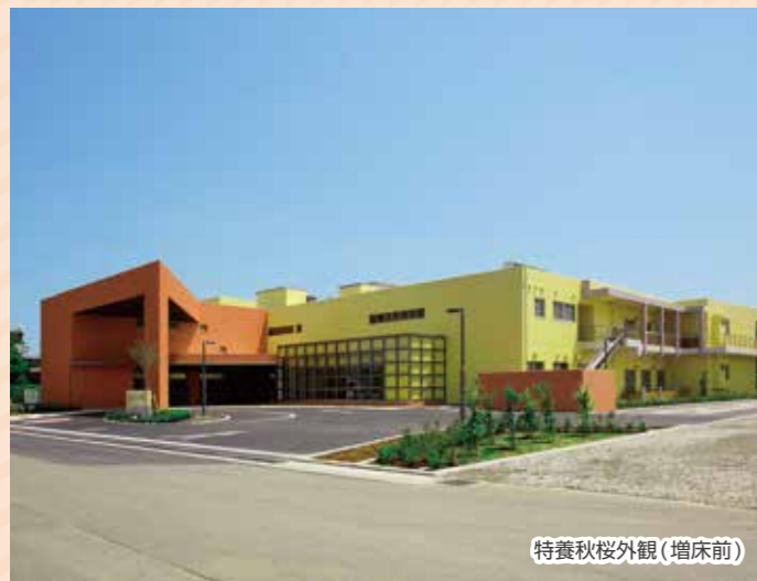
特養秋桜外観(増床前)