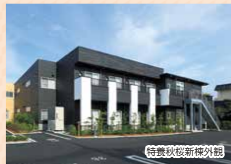
特養秋桜新棟外観