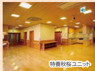
特養秋桜ユニット